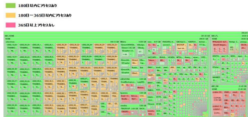
レポート例：スペースマップ 3 段階表示

本サービスは、国内企業約 300 社の利用実績を持つ株式会社デジベリーの有償サービス”ファイルセンサス・アセスメントサービス” *1 に、丸紅情報システムズによるストレージやバックアップに関するコンサルティング機能を付加し無償で提供するキャンペーン用サービスです。丸紅情報システムズでは、ファイルサーバ利用状況分析サービス無償実施キャンペーンを通じて顧客基盤の拡充を図ります。